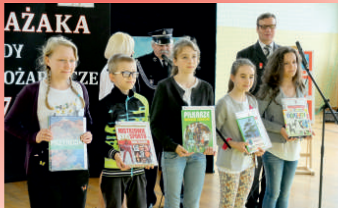
Uczniowie nagrodzeni w konkursie plastycznym