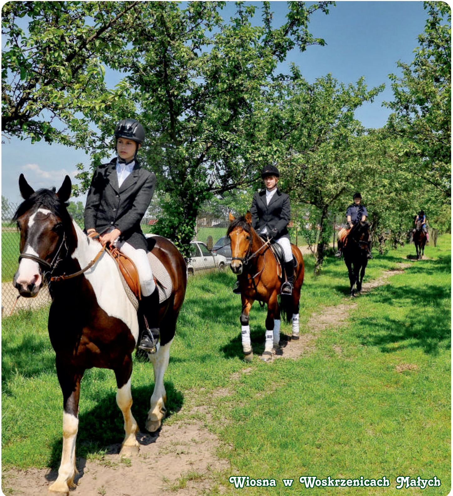
Wiosna w Woskrzenicach Małych