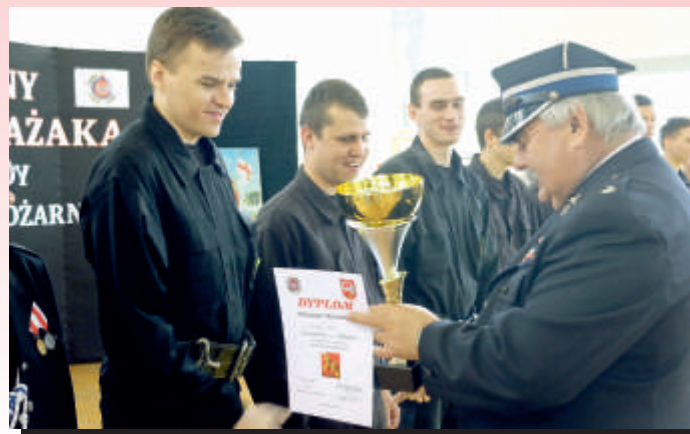
W tym roku najsprawniejszą okazała się drużyna z Ciecibora Dużego