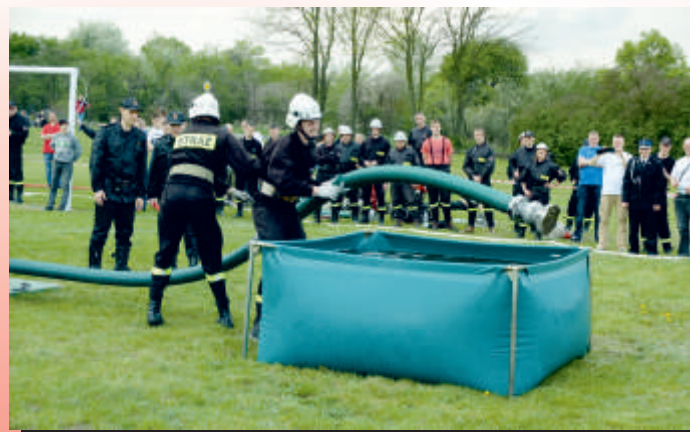
Publiczność dopingowała działania ochotników