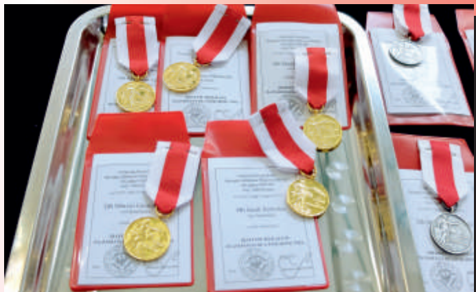
Medalami Za zasługi dla pożarnictwa wyróżniono 16 osób.