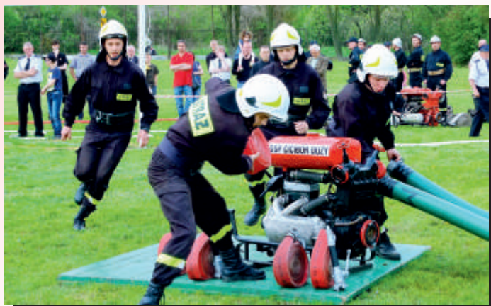
W ćwiczeniach bojowych liczą się szybkość i skuteczność