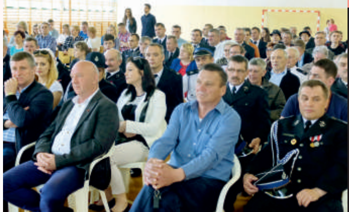
W obchodach strażackiego święta wzięli udział nie tylko radni