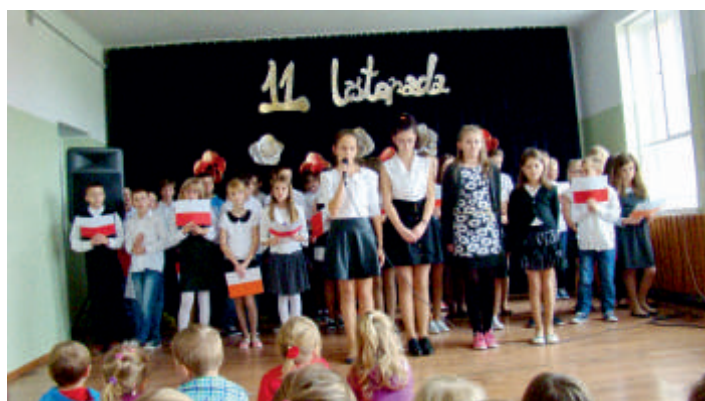
łagru, uczestnika bitwy o Monte Cassino oraz członków AK walczących z okupantem w powiecie białskim. (a)