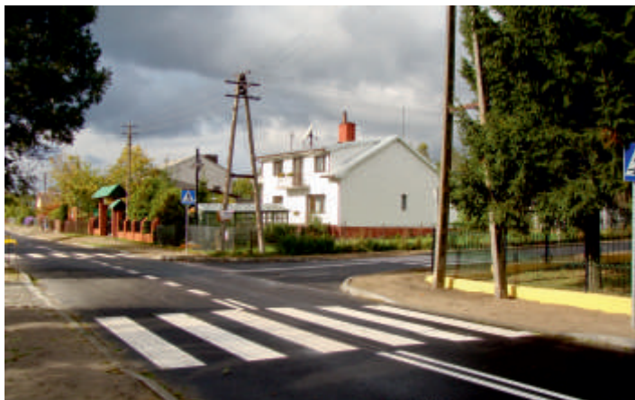
Piękna droga przez Sławacinek Stary kosztowała 4 mln 390 tys. zł.