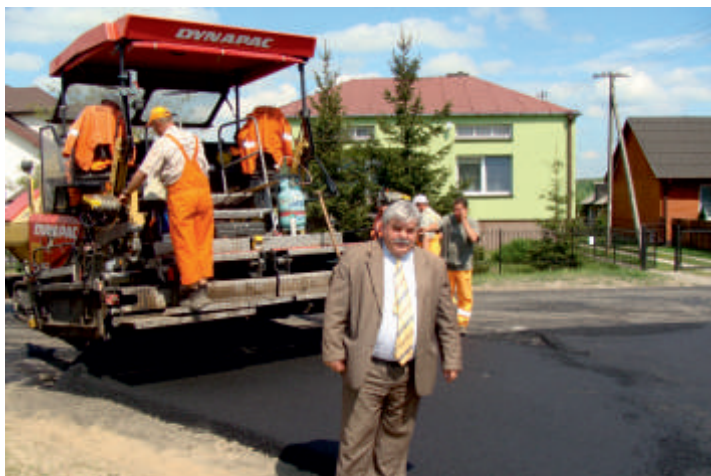
Budowa asfaltowej nawierzchni drogi w Czornówce.