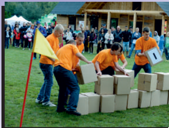
Publicność dopingowała swoich pupili