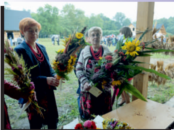
Rozstrzygnięcie konkursu na kwiatkę