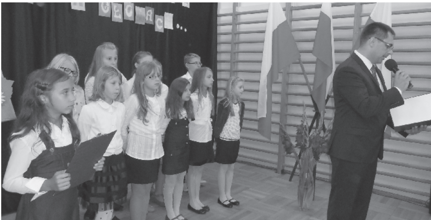
Inauguracja roku szkolnego w Hrudzie

nieograniczonego czasu wolnego, a rozpoczyna się wzmożona praca, dyscyplina czasowa i obowiązki. Będzie