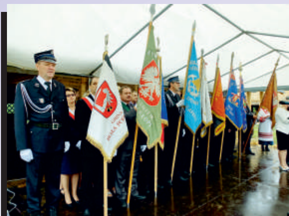
Prezentacja pocztów sztandarowych