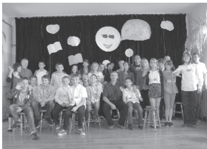
Pożegnanie ze szkołą i absolwentami