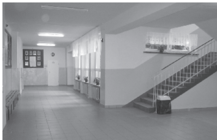
Odnowiony korytarz SP w Sworach

0 i punktów przedszkolnych. Natomiast w szkole niepublicznej w Dokudowie nowy rok szkolny rozpoczęło