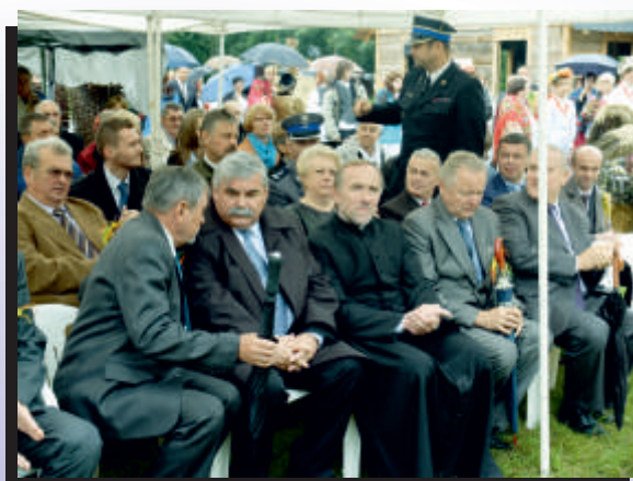
Dopisali zaproszeni na dożynki goście