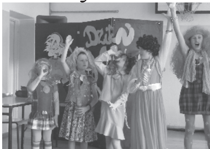
Szkolny Dzień Chłopaka