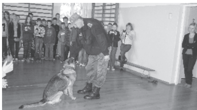
Pokaz tresury psów Służby Granicznej był atrakcją Dnia Dziecka