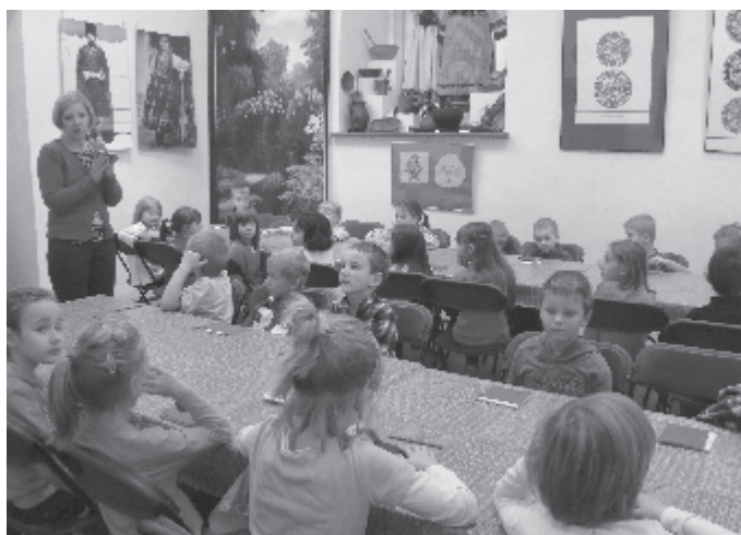
Zajmująca lekcja muzealna