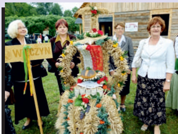
Wieniec delegacji z Wilczyna nawiązywał do darów ziemi