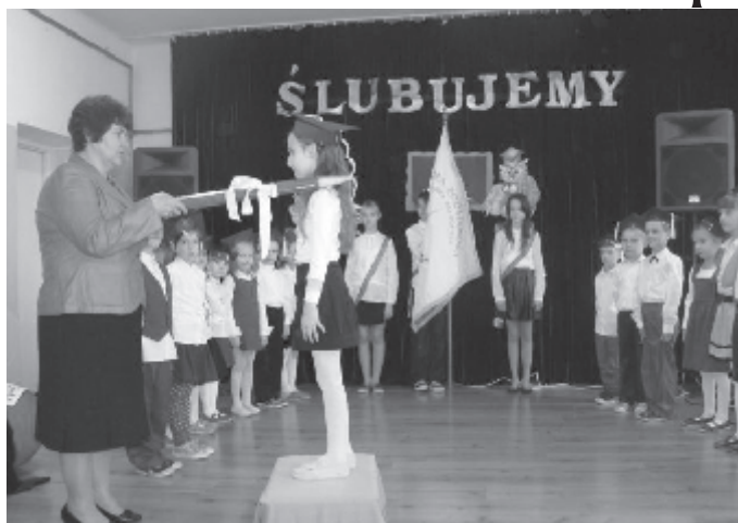
Ślubowanie pierwszaków to ważny dzień w życiu szkoły