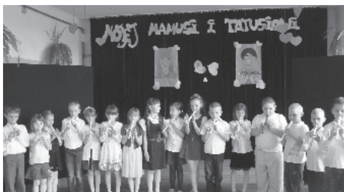
Zagrali dla mamusi i tatusiów