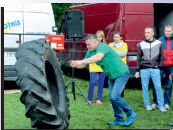
Mozolne przetaczanie opony na czas