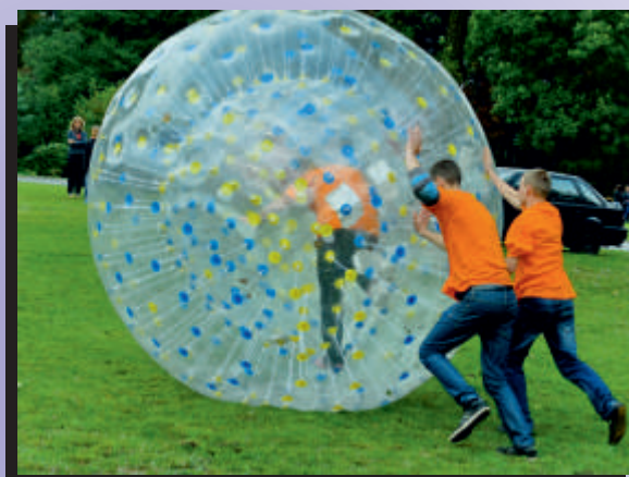
W turnieju sołectw trzeba było wykazać się różnymi umiejętnościami