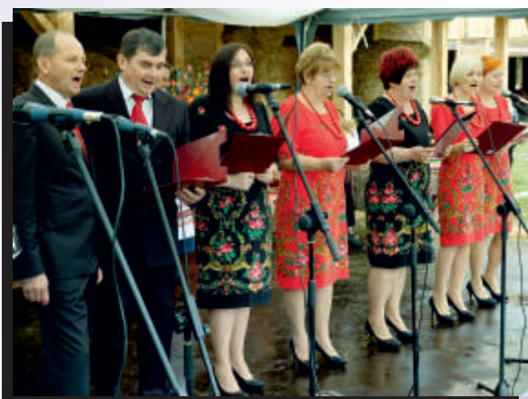
Zorza z Cicibora popisała się nie tylko efektownym wieńcem