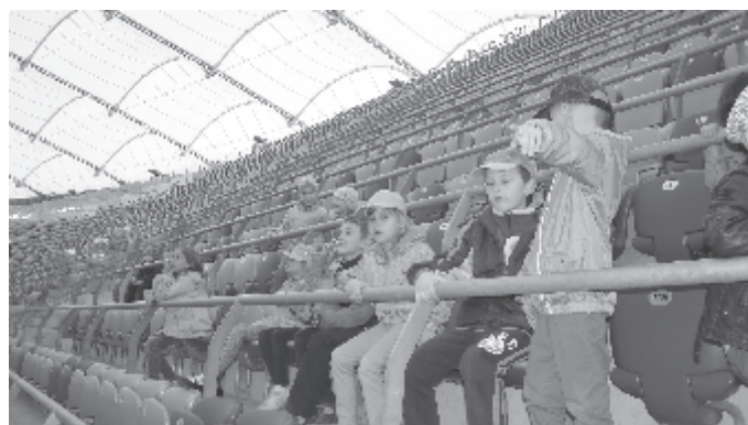
Najmłodszy na stołecznym Stadionie Narodowym